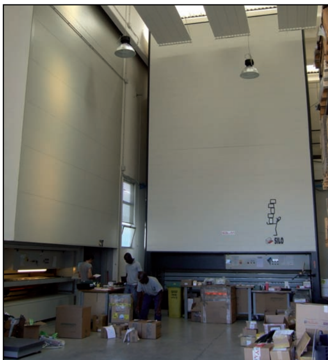
Ricambi, due magazzini computerizzati Spare parts, two computerized stores

Se siamo riusciti ad arrivare fin qui, il merito è soprattutto dei nostri Uomini, una squadra di professionisti spinti da una comune passione: dare il meglio di se stessi.