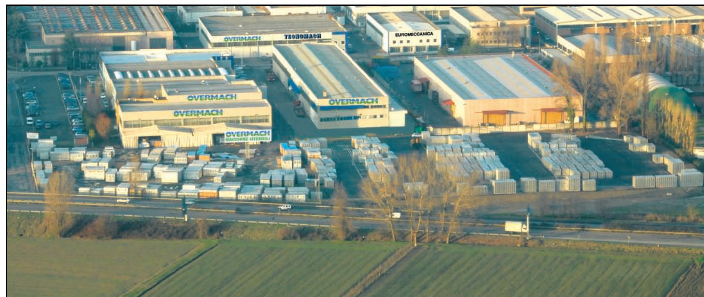
VEDUTA AEREA DELLA SEDE DI PARMA DI 48.000 m² CON 14.000 m² COPERTI / AIR VIEW OF PARMA SEAT OF 48.000 s.mt. WITH 14.000 s.mt. COVERED AREA

TECNOMACH SERVICE dispone di una struttura di oltre 78 dipendenti di cui: 4 ingegneri, 25 tecnici meccanici, 22 tecnici elettrici ed elettronici, 9 programmatori e un adeguato stock di ricambi. L'esperienza acquisita sul campo e la professionalità dimostrata sono fondamentali elementi su cui poggia l'Azienda. Possiamo pertanto assicurare che il "Service" rappresenta un punto di forza del Gruppo Overmach la cui Clientela può contare su un'assistenza all'altezza per capacità tecnica e tempestività.