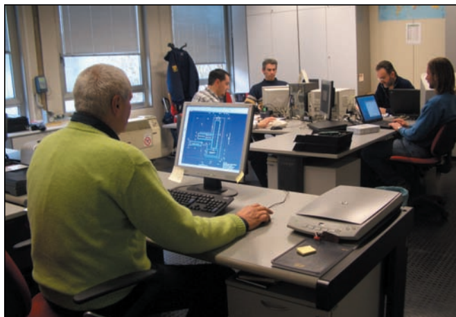
Ufficio Tecnico e Progetti - Technical and Design Department

Un qualificato e affermato Gruppo, come Overmach, non poteva non avere un Service all'altezza. E' per questa ragione che fin dal 1987 è sorta TECNOMACH SERVICE .