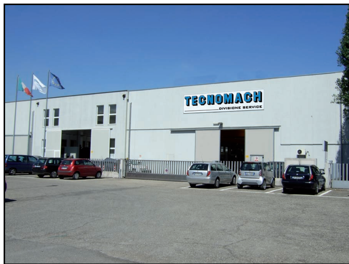
VISTA DELL'IMMOBILE DA VIA BARBACINI

Grazie alla nostra competenza e dedizione siamo in grado di assicurarVi una maggiore ed ottimale disponibilità di utilizzo dei Vostri macchinari.