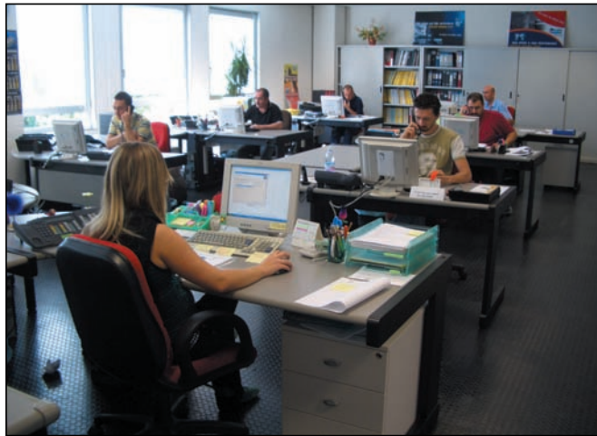
Ufficio Assistenza Telefonica - Service Call Center